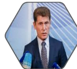
Кожемяко Олег Николаевич Губернатор Приморского края

1514 УНИКАЛЬНЫЙ ПРОСМОТР 798 ПРОСМОТР ПО ИТОГУ