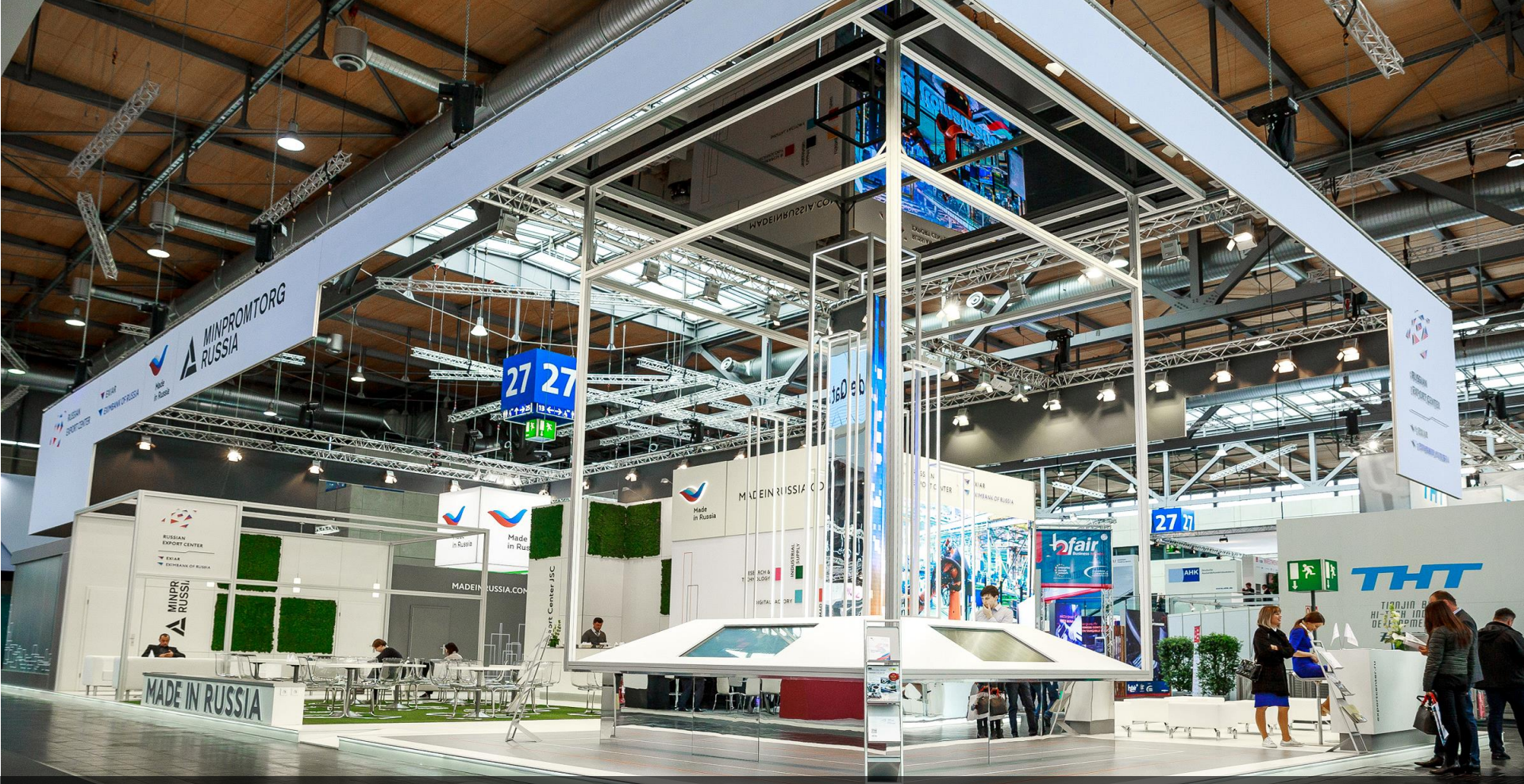
КОЛЛЕКТИВНЫЙ СТЕНД РЭЦ